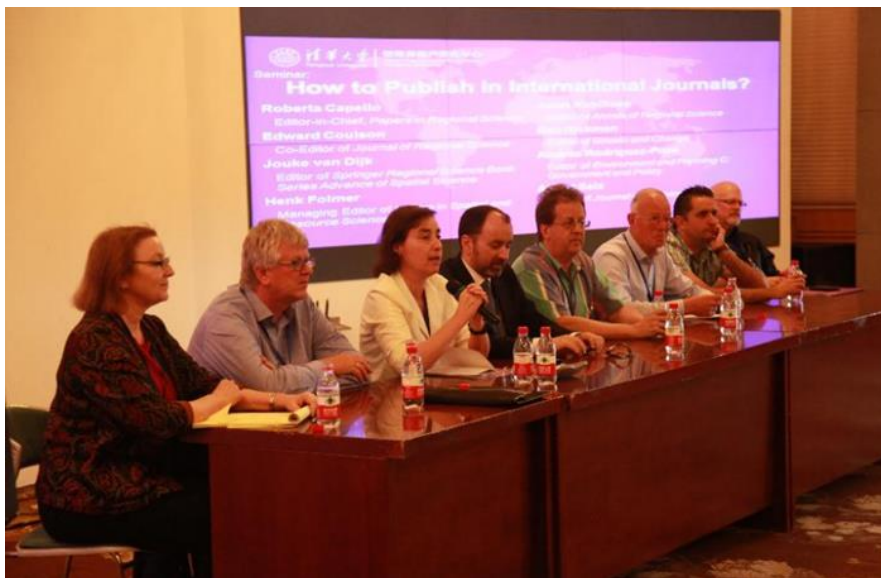
期刊主编介绍如何在国际期刊上发表论文

最后，八位本领域高水平 SSCI 期刊主编还就“如何在国际期刊上发表论文”与参会学者进行了交流，大家抓住这次难得的机会踊跃提问、受益匪浅。