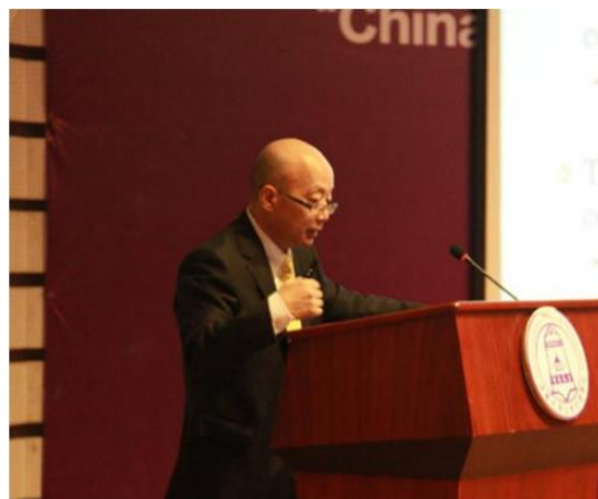
周黎安教授 (北京大学光华管理学院应用经济系主任)